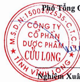
Nghiêm Xuân Trường