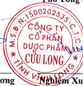
Nghiêm Xuân Trường